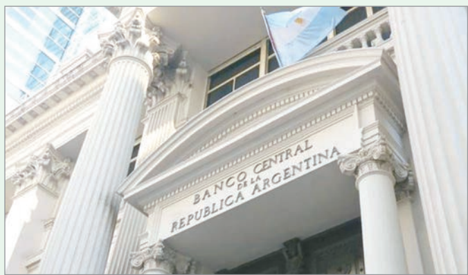
El BCRA permite a bancos locales suscribir letras provinciales por $620.000 millones