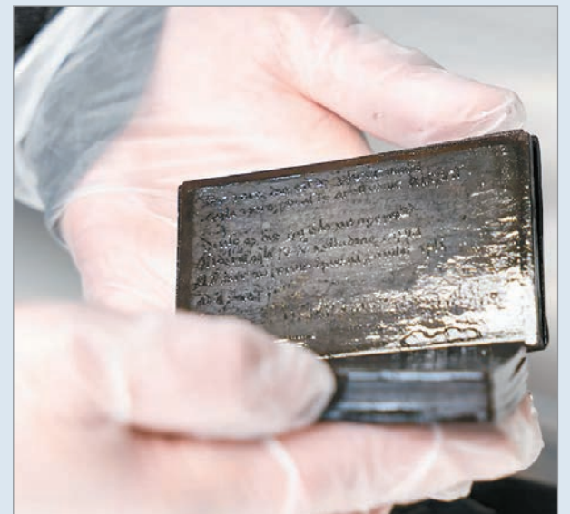
Un cuaderno medieval apareció en una letrina excavada en Paderborn, Alemania.