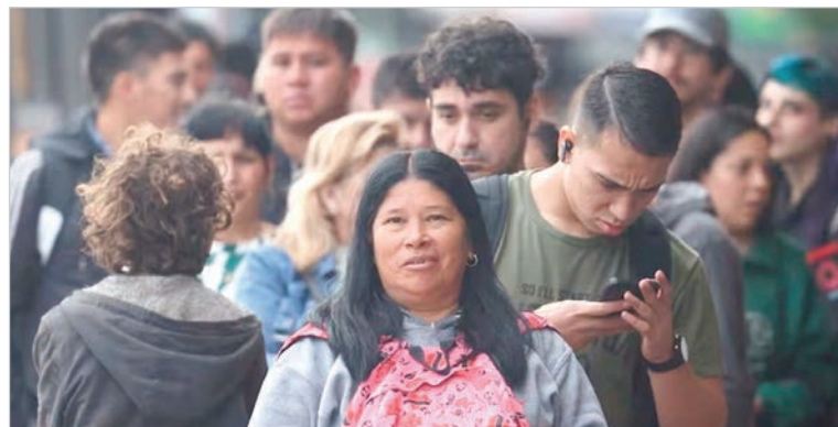
Volvió a subir la informalidad

A su vez, la tasa de informalidad tocó su nivel más alto desde el inicio de la serie en el cuarto trimestre de 2023: se ubicó en 44,2%. Esto implicó que en los tres primeros meses del año casi 6 millones de argentinos trabajaron sin derechos en los 31 aglomerados urbanos.