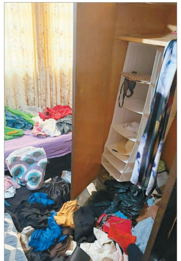
Revolveron toda la casa

Con todo eso huyeron del lugar con total tranquilidad como si nada hubiera ocurrido y sin levantar ningún tipo de sospechas.