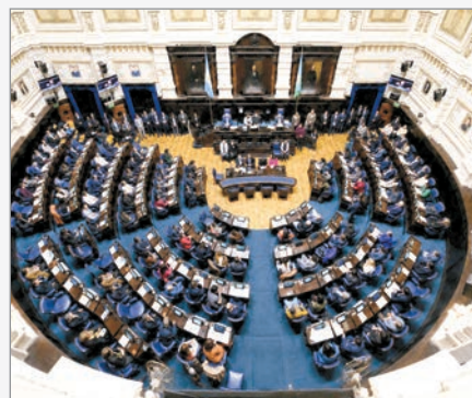
LLA retiró el proyecto en Diputados bonaerenses

La Libertad Avanza (LLA) decidió retirar de la Cámara de Diputados bonaerense el proyecto que buscaba desregular el mercado inmobiliario en la provincia de Buenos Aires. Se trata de una iniciativa impulsada por el ministro de Desregulación y Transformación