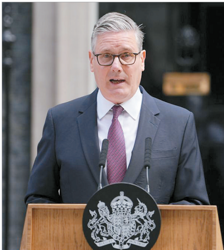
Con la renuncia de Starmer se abre una etapa de incertidumbre política

Pese a la crisis política, Starmer defendió su gestión y destacó avances económicos, inversiones en infraestructura y medidas destinadas a reducir las listas de espera del sistema