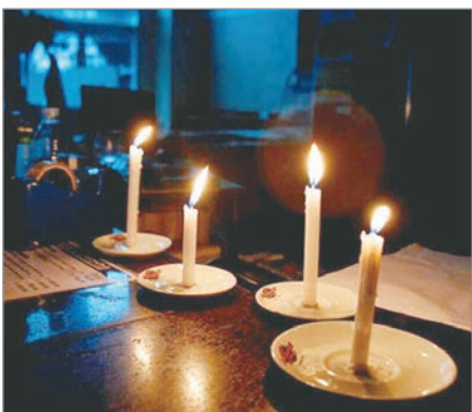
Un informe alerta por la caída de la calidad

Un informe del Instituto Argentino de Estudios Técnicos, Económicos y Sociales (Iaetes) reveló que las tarifas eléctricas en el Área Metropolitana de Buenos Aires (AMBA) en el primer año de la Revisión Quinquenal Tarifaria (abril 2025 - mayo 2026) tuvieron un aumento