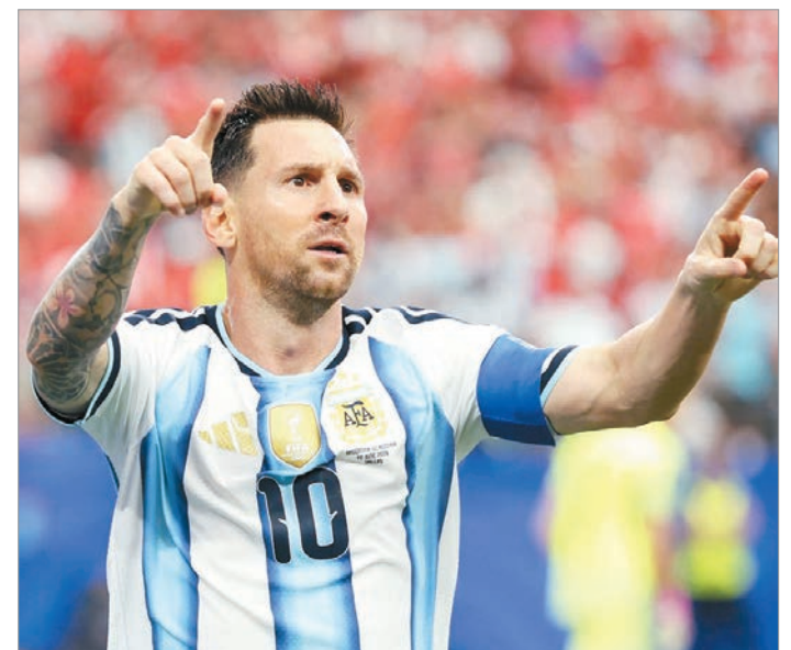
Tabla de artilleros - Copas del Mundo

Messi suma 122 goles en 201 partidos con la Albiceleste, mientras que Cristiano continúa al frente del ranking histórico de goleadores de selecciones con 143 tantos (el último fue ante Hungría en octubre de 2025 por las Eliminatorias UEFA). Sin embargo, ambos comparten un récord que parecía imposible hace algunos años: son los únicos futbolistas que disputaron seis Copas Mundiales de la FIFA.