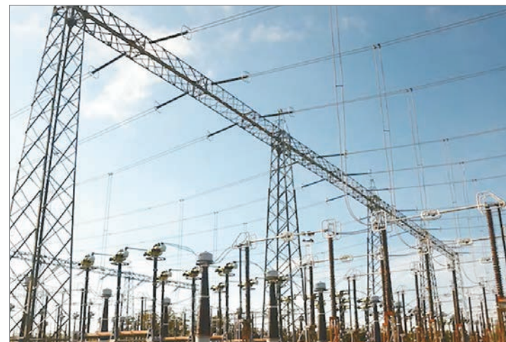
El ente regulador aprobó la transferencia de acciones a Edison y Genneia

Cabe mencionar que, según la resolución, el marco regulatorio vigente limita eventuales posiciones dominantes mediante el acceso abierto a las redes de transporte, tarifas reguladas y mecanismos de control estatal. La venta se realizó a través de una licitación pública y constituye uno de los pasos más relevantes del proceso de desinversión impulsado por el Gobierno nacional en el sector energético.