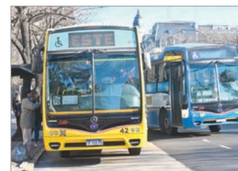
El gremio insiste en la recomposición y amenaza con medidas de fuerza en el transporte público

La Unión Tranviarios Automotor (UTA) volvió a advertir sobre posibles medidas de fuerza ante la falta de acuerdo salarial y responsabilizó tanto al sector empresario como al Gobierno nacional por el estancamiento de las paritarias. El gremio denuncia que los choferes pierden poder adquisitivo frente a la inflación