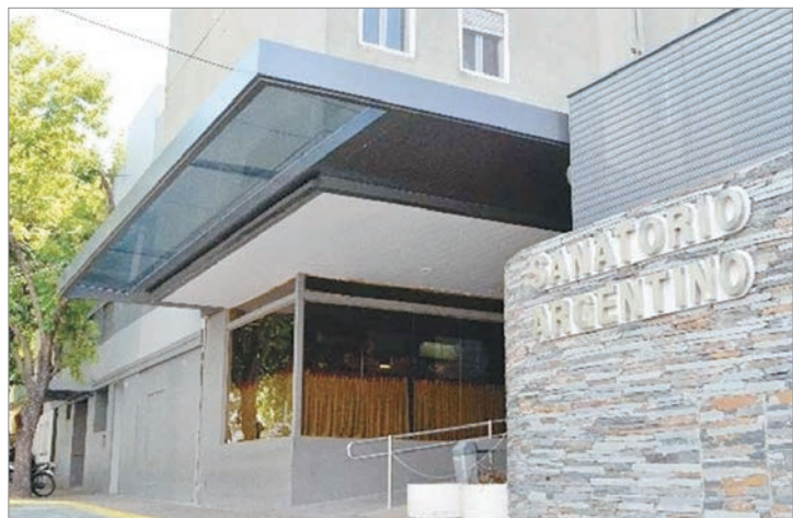
El denunciante había sido trasladado al Sanatorio Argentino

Finalmente, condenaron a la aseguradora a pagar una suma de $285.980.239,88, más intereses, llevando el monto total liquidado a $351.246.415,17.