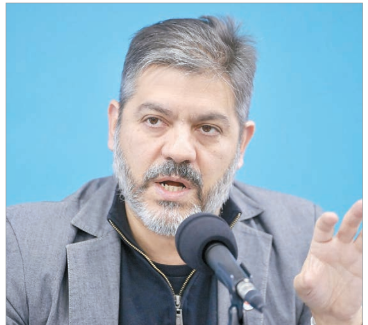
Bianco ironizó sobre la deuda de Nación y Adorni

El ministro también volvió a cuestionar la paralización de la obra pública nacional y aseguró que permanecen abandonados cerca de mil proyectos en territorio bonaerense, entre ellos más de 16 mil viviendas y decenas de establecimientos educativos. Según indicó, varias de esas obras fueron retomadas por la administración provincial.