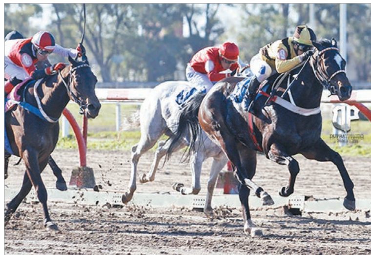
Quiere repetir. Tac-Tac viene de ganarle chiquito a Frapé y hoy vuelven a verse las caras

Carrera reservada para yeguas de 4 años y más edad, ganadoras de tres o más carreras, ocupa el séptimo turno de programación, con el buen número de 12 participantes, dispuestas a luchar por los $6.140.000