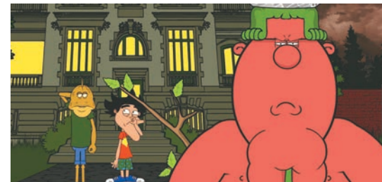
Imagen del proyecto

—Ay muy difícil elegir un favorito. Pero... Gordo Morrón, hoy es el más relevante. Lo vemos en cada esquina, en cada rincón de cada red social. Todos conocemos un Gordo Morrón.