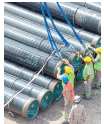
Diputados tratarán el Super RIGI

Si bien el oficialismo argumenta el proyecto al buscar “una mayor industrialización de los recursos del país y promover el desarrollo de nuevas cadenas de valor”, decenas de organizaciones se expresaron en contra.