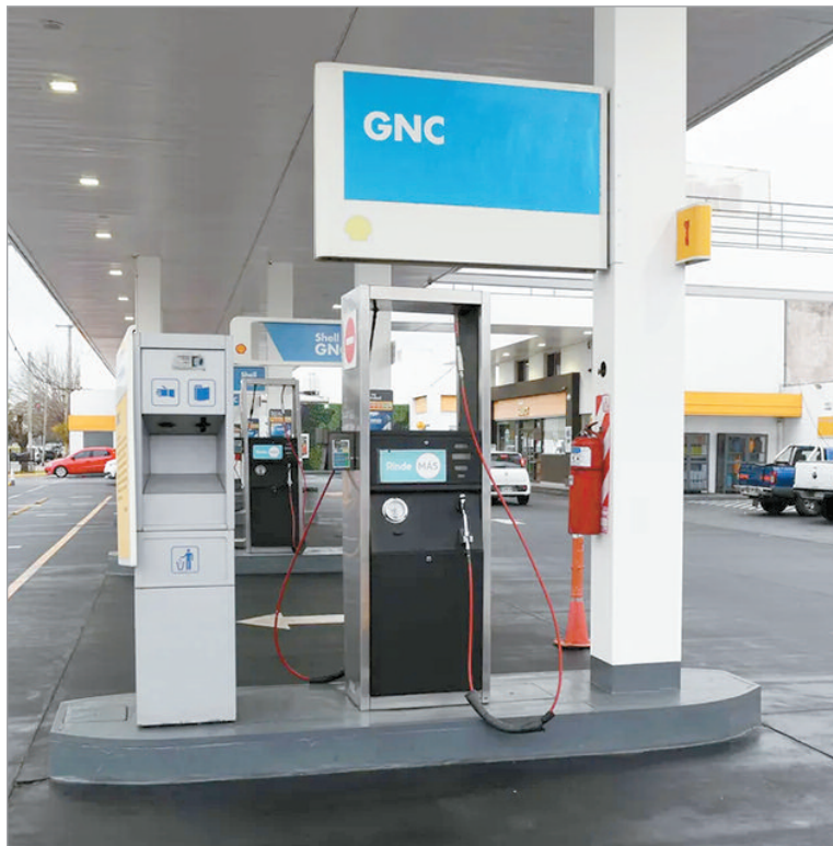
Taxistas y conductores se movilizan ante las restricciones