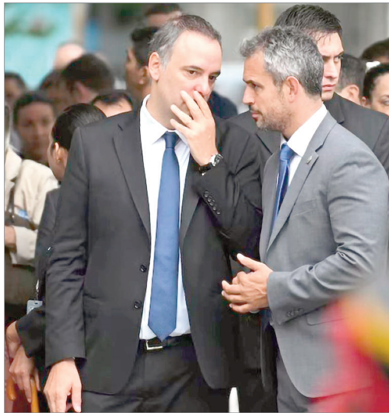
Adorni gana una semana en el Congreso

“La creatividad del oficialismo para violar la Constitución no tiene límites. Como no tienen argumentos para defender al jefe de Gabinete, se pusieron a inventar obstáculos, dilaciones parlamentarias y a hacer trampa para que la interpelación y la moción de censura vaya a comisión”, denunció el diputado de la Coalición Cívica, Maximiliano Ferraro.