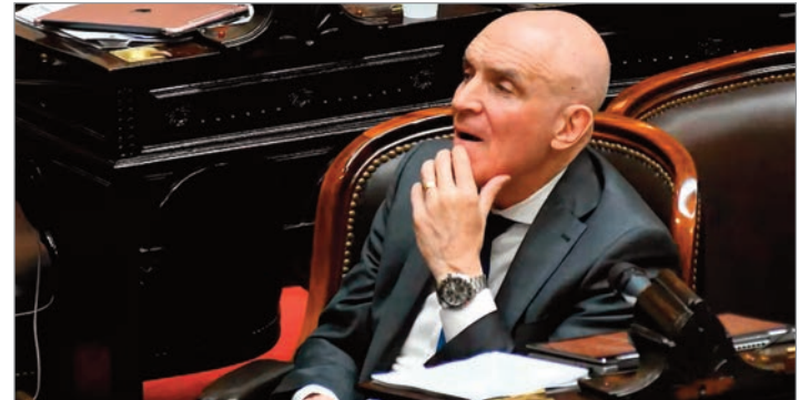
La fiscalía lo acusa de falsificar un contrato y agrava la causa por lavado de activos

Los investigadores sospechan que parte de los fondos podrían estar relacionados con Federico "Fred" Machado, empresario extraditado a Estados Unidos que admitió maniobras de lavado. Para los fiscales, las pruebas reunidas refuerzan las sospechas y dejan sin sustento la principal defensa de Espert, agravando su situación judicial y política.