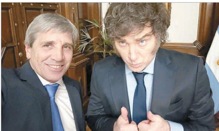
El decreto 478/2026 abre la puerta a reclamos en tribunales estadounidenses

La medida implica que la Argentina renuncia a la defensa de inmunidad de jurisdicción frente a even-