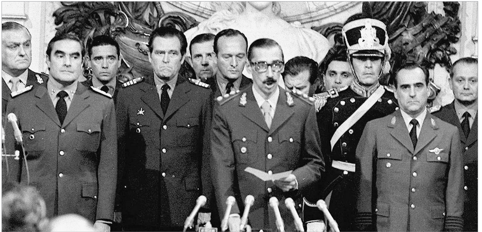
Juramento de Jorge Rafael Videla como presidente de facto en 1976

Crítico de la Dictadura que sistemáticamente intervenía gremios adversos y culpaba de todos los males nacionales al sindicalismo, exhortó al país a deponer partidismos que agrietaban la fuerza de la sociedad civil, a distinguir bien al enemigo, y acordar, entre todos los sectores, un convenio para salvar la República. El 28 de enero de 1977, el director general de la Organización Interna-