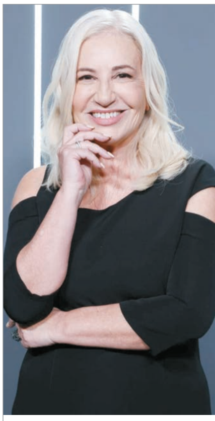
Tiene pendiente de estreno una serie

La popular y querida actriz acaba de publicar su libro y reflexiona sobre el momento actual del audiovisual