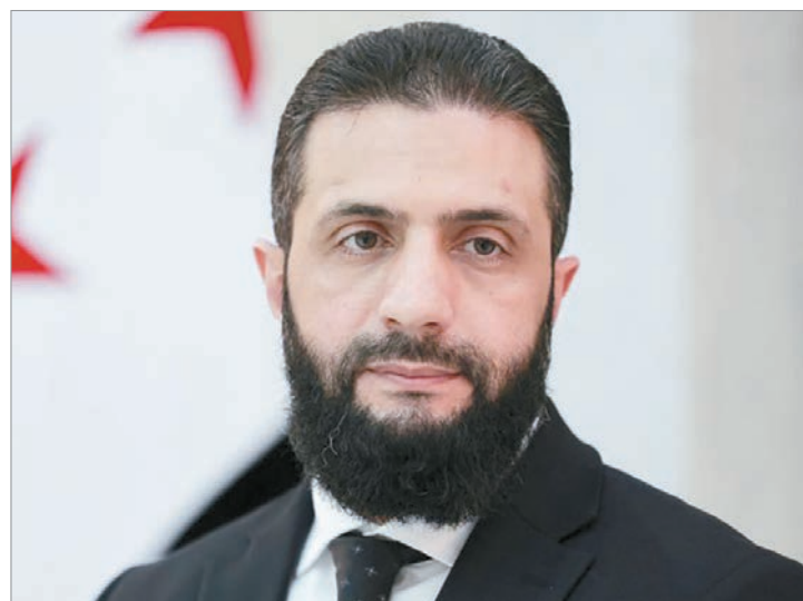
El presidente sirio Ahmed al Sharaa afirmó que está dispuesto a ser mediador

En ese contexto, Siria intenta presentarse como un posible intermediario regional, con una postura que prioriza las negociaciones frente a una salida basada en nuevas acciones militares.