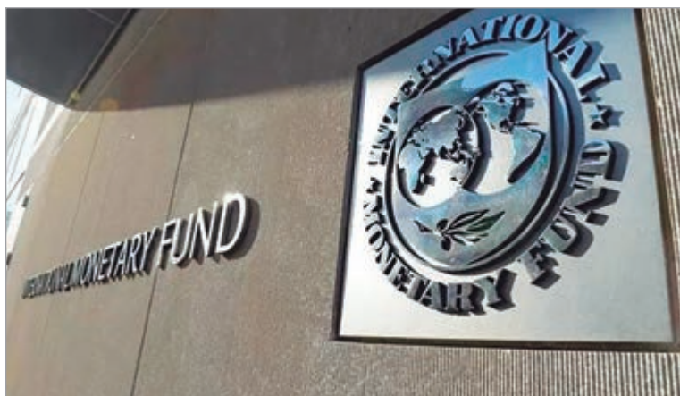
El Fondo habló de empleo informal y deuda sin plazos

El organismo advirtió por el aumento del trabajo precario y evitó fijar fecha para el regreso de Argentina a los mercados internacionales