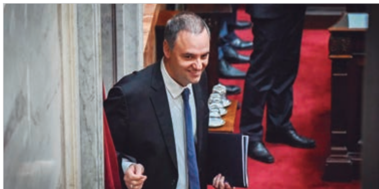
Adorni ganó una semana más de tiempo

En cuanto al peronismo, José Mayans, jefe del bloque, señaló que “los responsables de dar el quórum