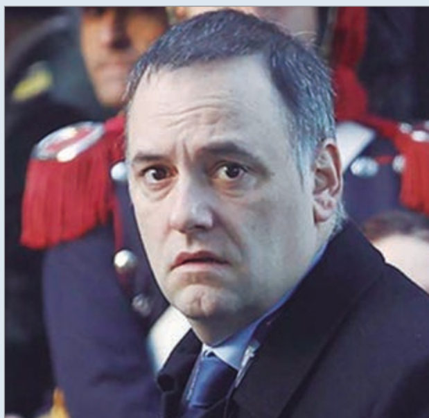
El fiscal Pollicita se prepara para exigir justificación patrimonial al funcionario

La investigación sobre el patrimonio de Manuel Adorni continúa acumulando pruebas. El fiscal federal Gerardo Pollicita amplió los requerimientos de información a organismos públicos y privados y se prepara para solicitar una justificación patrimonial, paso que podría derivar en una citación a indagatoria por presunto enriquecimiento ilícito.