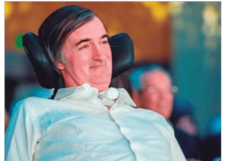
El exsenador se apartó del partido y criticó el respaldo a Manuel Adorni

La renuncia de Bullrich deja al PRO expuesto como un espacio que se acomoda a conveniencias y protege figuras cuestionadas, un signo de desgaste que erosiona su credibilidad política.