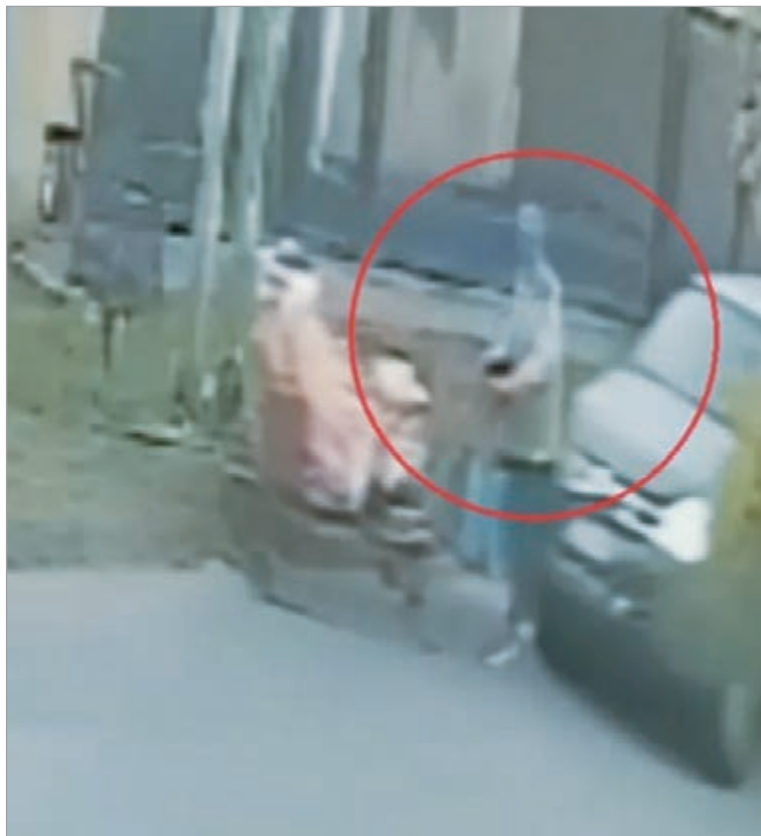
Todo quedó filmado

Los investigadores también analizan otros registros filmicos de la zona y toman declaración a posibles testigos con el objetivo de reconstruir los movimientos del automovilista