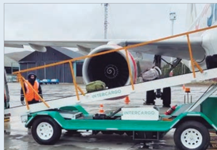
El Gobierno no recibió propuestas y quedó en suspenso la venta de la empresa de servicios aeroportuarios

El fracaso del proceso deja en suspenso el plan oficial de desprenderse de la empresa y expone las dificultades para atraer capital privado en un sector estratégico. La falta de interés empresarial marca un revés político para el Gobierno y abre interrogantes sobre la viabilidad de su programa de privatizaciones, que buscaba mostrar resultados concretos en medio de tensiones económicas y sociales.