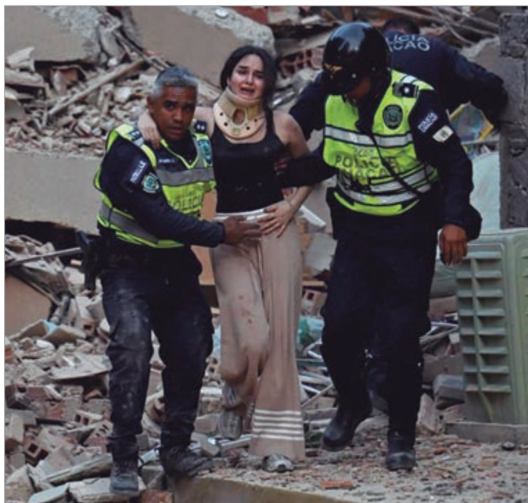
Equipos de emergencia mantienen los trabajos en las zonas más afectadas

Especialistas explicaron que el fenómeno registrado corresponde a un "doblete sísmico", debido a que dos terremotos de gran magnitud ocurrieron con apenas segundos de diferencia. Según expertos, este tipo de evento se produce cuando la actividad de una falla genera movimientos adi-