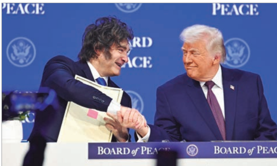
Milei busca proveerle materia prima a EE. UU. para la IA

Desde que Donald Trump llegó a la presidencia, la gestión de Javier Milei decidió apoyar a Estados Unidos en todas sus iniciativas. Entre ellas, se incluyeron varias polémicas, como el retiro de Argentina de la Organización Mundial de la Salud. Ahora, el canciller Pablo Quirno anunció la incorporación del país a Pax Silica.