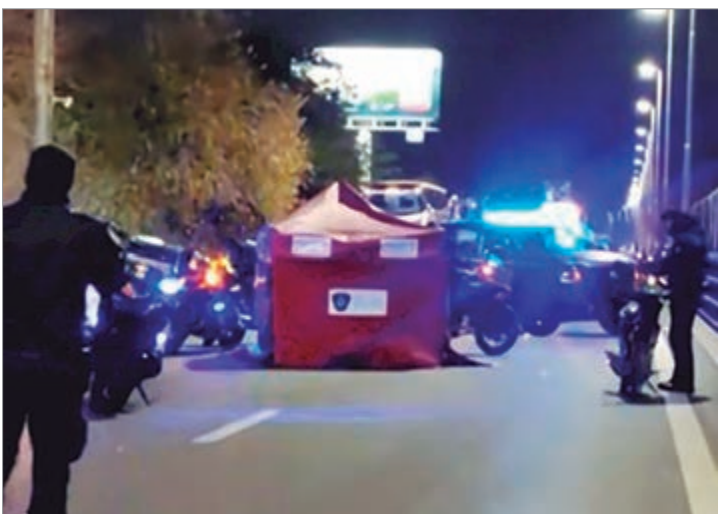
La zona del hecho

En el lugar trabajaron efectivos de la Policía de la Ciudad, personal de la Policía Científica y agentes de Autopistas Urbanas Sociedad Anónima (AUSA), quienes realizaron las pericias correspondientes para determinar con precisión la mecánica del hecho y preservar las evidencias.