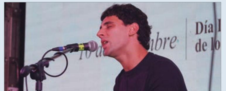
La inscripción permanecerá abierta hasta el 30 de junio

Para participar de la convocatoria, cuya fecha de cierre será el martes 30 de junio, los participantes deberán completar un formulario, donde también figuran las bases y condiciones