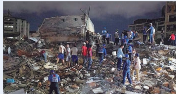
Países de América, Europa y Asia anunciaron el envío de asistencia

La ayuda internacional comenzó a organizarse mientras Venezuela mantiene los operativos de emergencia y continúa evaluando el impacto del terremoto, considerado uno de los más fuertes registrados en el país en las últimas décadas.