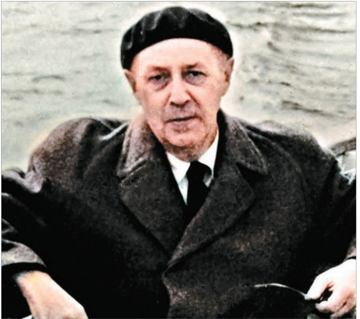
El escritor vivió 89 años y se suicidó tras la seguidilla de muertes de sus familiares

Sandor Marai es uno de los mayores escritores de la historia de Hungría, que se vio obligado a enfrentarse a la locura y el crimen