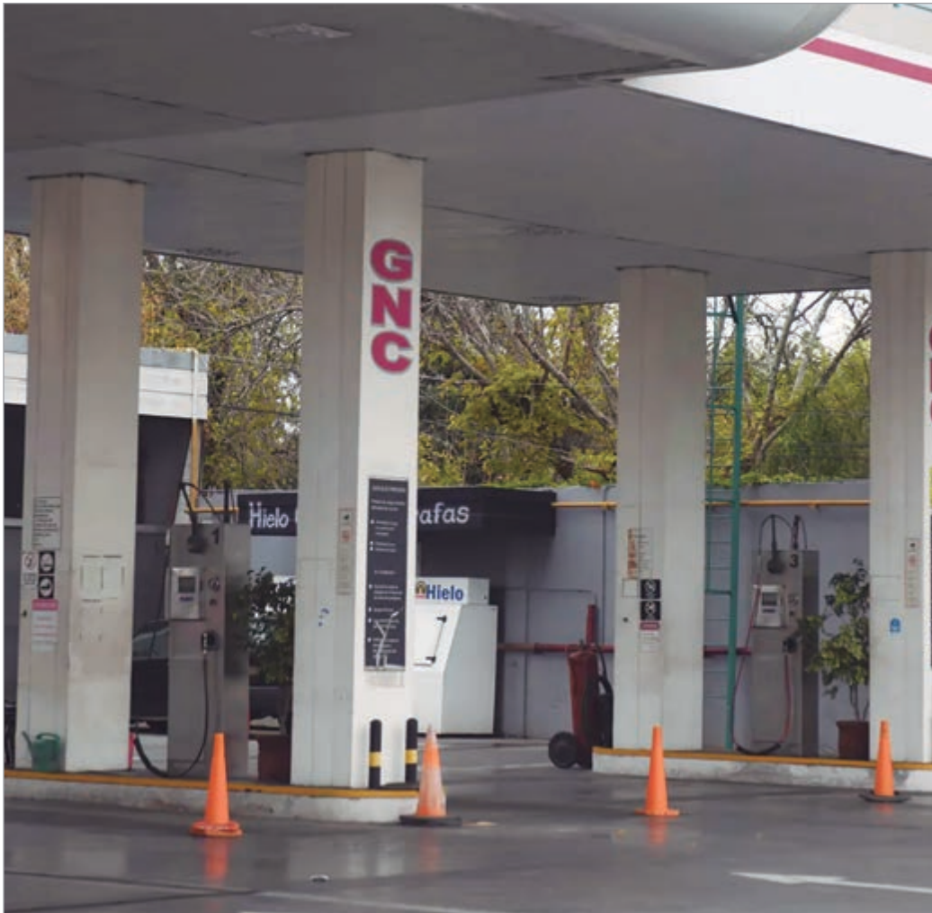
Responsabilizan al gobierno de Milei por la falta de gas