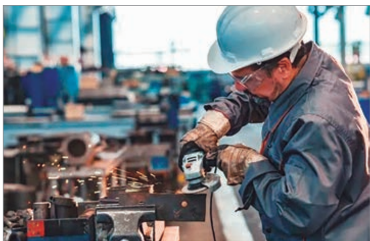
El sector suma una contracción de 2,3% en lo que va del año