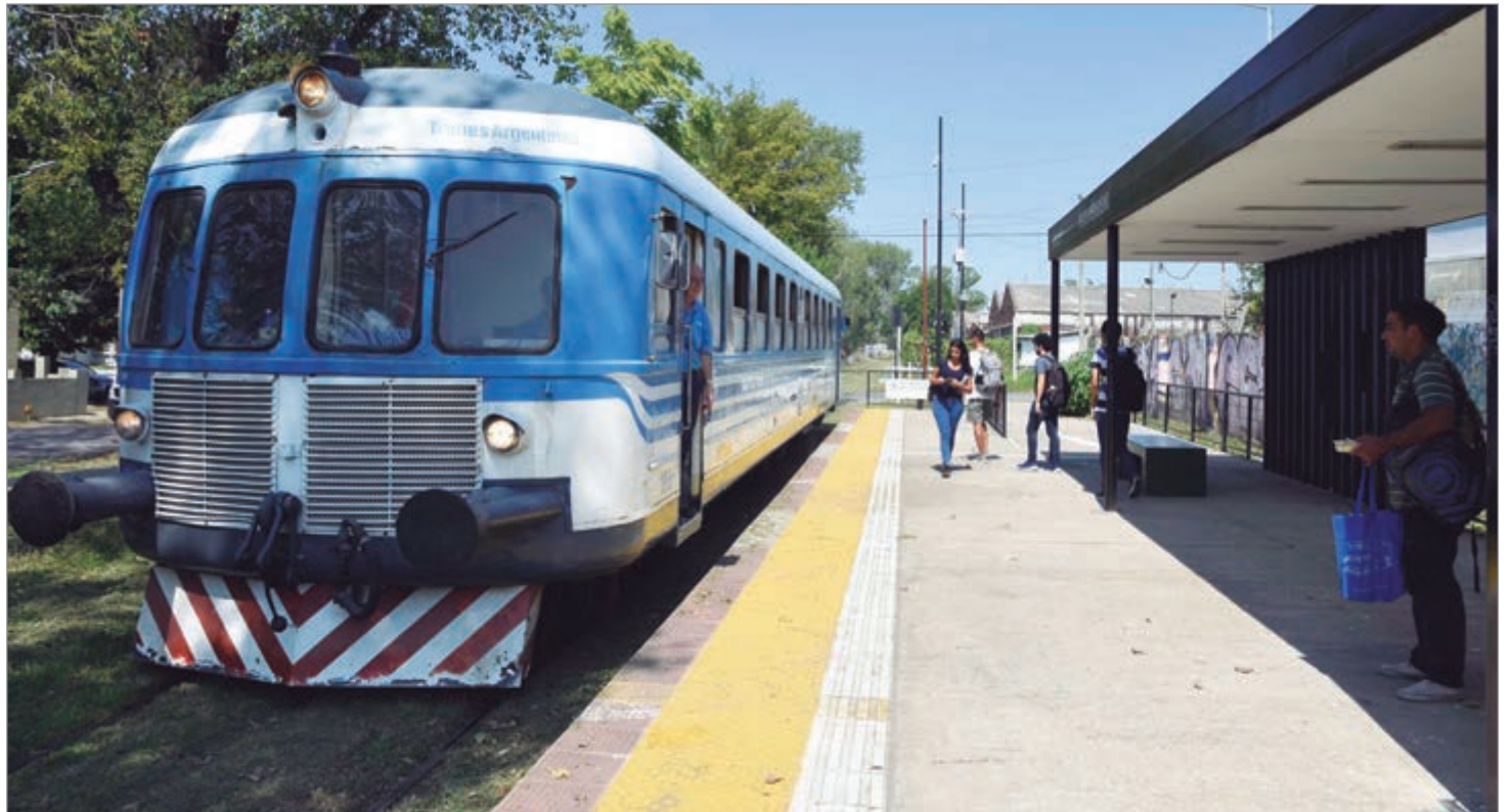
La primera parada será a las 10 en la estación Policlínico, en 1 y 72

La primera parada será a las 10 en la estación Policlínico (1 y 72) y la segunda en la Estación Meridiano V (17 y 72) a las 12.