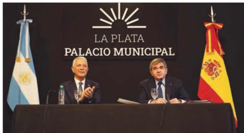
Será en octubre

Cabe recordar que el plan de obra de Plaza España supone un presupuesto superior a los $2.643 millones. La intervención incluye una reconfiguración integral del espacio verde con mejoras en infraestructura y equipamiento urbano. El proyecto contempla la reubicación de monumentos, la incorporación de áreas de descanso, juegos infantiles y espacios deportivos.