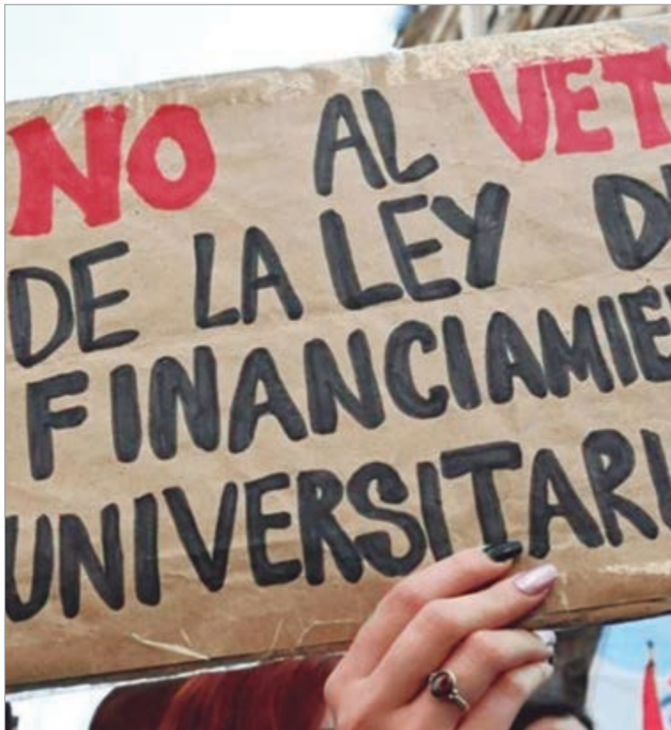
El fallo consolida derechos salariales y programas

El caso se originó en una acción de amparo colectivo impulsada por el Consejo Interuniversitario Nacional y distintas universidades nacionales. La justicia contencioso administrativa federal había ordenado, antes de resolver el fondo de la cuestión, que el Gobierno cumpliera de inmediato con parte de la ley. Esa orden alcanzó a los artículos 5 y 6, referidos a la actualización de salarios del personal docente y no