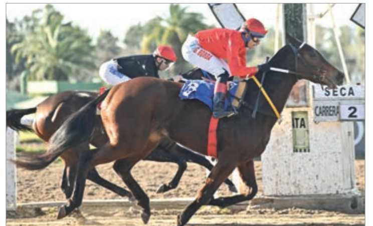
La del "Pauli", imparable. Tardona recuperándose de una mala salida, muy cerca del disco dominó a La Manteca.

La potranca ganadora, empleó el buen registro de 1m.25s.91/100 para los 1.400 metros de pista seca y es idea de los responsables de su campaña que siga compitiendo en este hipódromo.