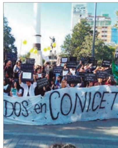
Denuncian el brutal ajuste a la ciencia

Ante esto, la comunidad científica convocó a una nueva marcha para el 1º de julio en el Polo Científico, en el barrio porteño de Palermo. También denuncian la falta de cobertura médica, demoras en concursos y el fuerte ajuste a la ciencia.