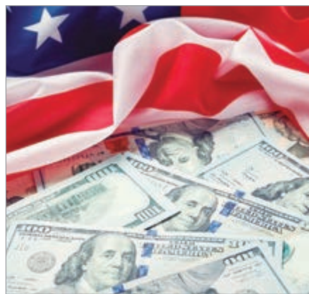
El aumento en los precios de la gasolina impulsó el índice de inflación

La inflación anual en Estados Unidos alcanzó en mayo su nivel más alto en tres años, impulsada principalmente por el incremento en los precios de la gasolina. Según los datos difundidos por el Departamento de Comercio, el