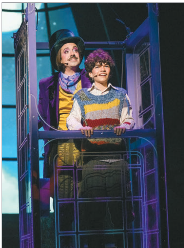
En el escenario caracterizados como Willy Wonka y Charlie

—AR: La última fue Wonka , si no me equivoco. La de Tim Burton es un poco más oscura. Pero es una es una comedia, es una gran comedia con una bajada tremenda sobre sí. Yo te aviso, esto no lo hagas porque vas a tener consecuencias. Bueno, lo haces y lo lindo es que ganan los buenos. O sea, el bien le gana al mal,