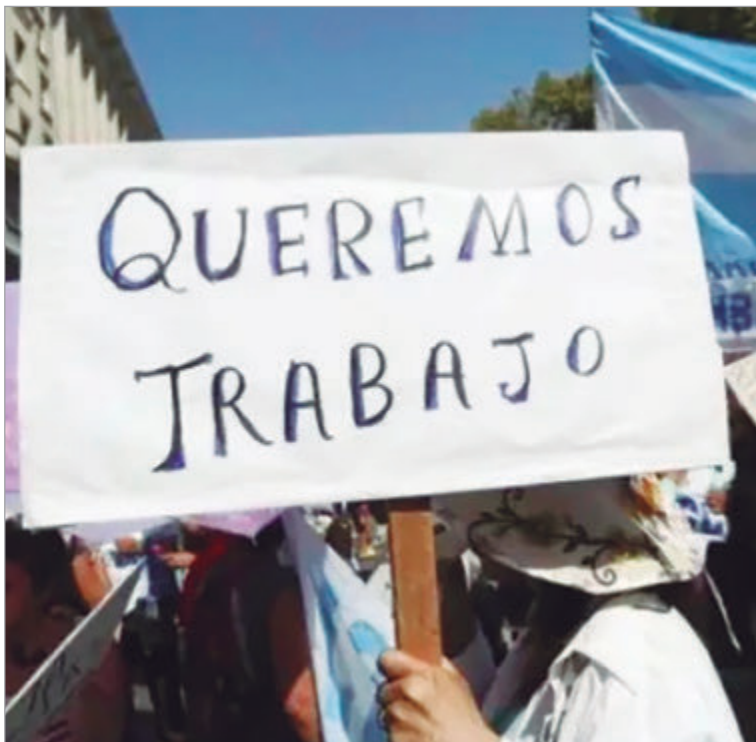
La Provincia concentra informalidad y desempleo como rostro del modelo agotado

El desempleo se consolida como otro de los problemas centrales. Bue-