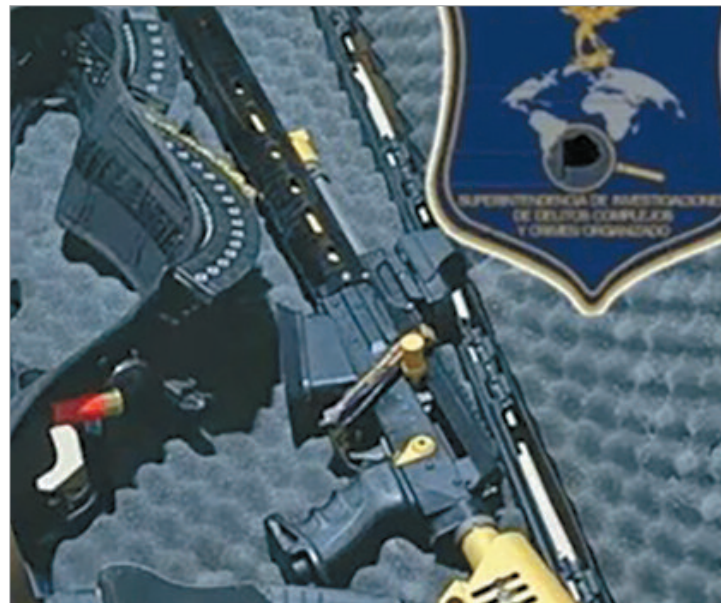
Parte de lo incautado

"Lejos de combatir criminales reales, se utilizaron recursos y tiempo en un deportista reconocido dentro de la disciplina", expresaron desde el estudio jurídico.