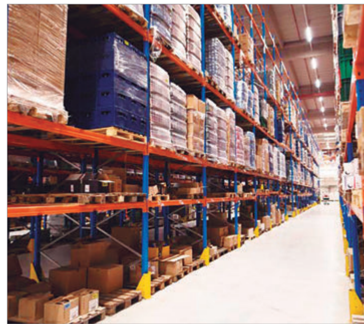
Las compras externas se disparan mientras el comercio y la industria se hunden

Aunque todavía representan una fracción menor del comercio exterior, las compras por courier reflejan uno de los efectos más visibles de la apertura económica. El boom de importaciones minoristas se instala como símbolo de un modelo que celebra récords externos mientras profundiza la crisis interna.