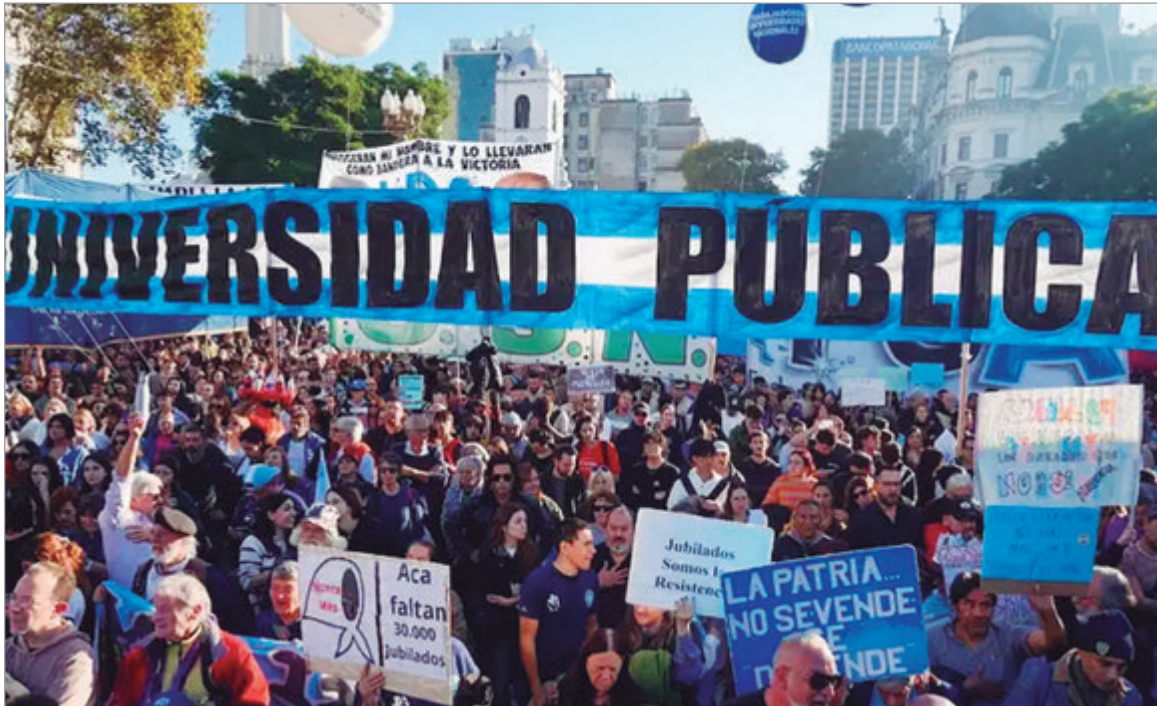
Nación deberá ajustar las partidas a las universidades

Luego del fallo de la Corte que obliga a la gestión de Milei a cumplir con la ley, al interior del Ejecutivo se analiza cómo continuar