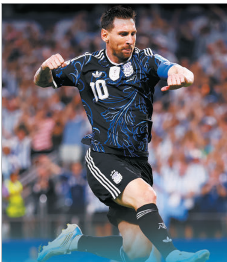
Los cruces de 16avos de final

En el inicio del complemento el rival sorprendió a propios y extraños