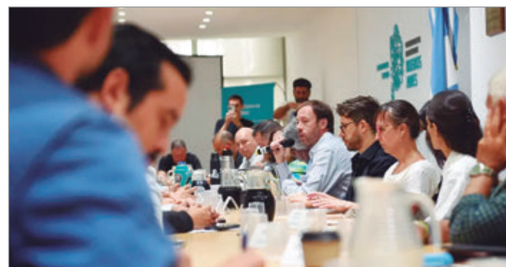
La Provincia sigue sin convocar a paritarias

En tanto, el Frente de Unidad Docente Bonaerense (FUDB) ya había reclamado una recomposición antes del cierre de las liquidaciones salariales. Según trascendió en la dirigencia gremial, los referentes del sector le hicieron saber al Ejecutivo que las dilaciones podrían abrir paso a medidas de fuerza en el corto plazo.