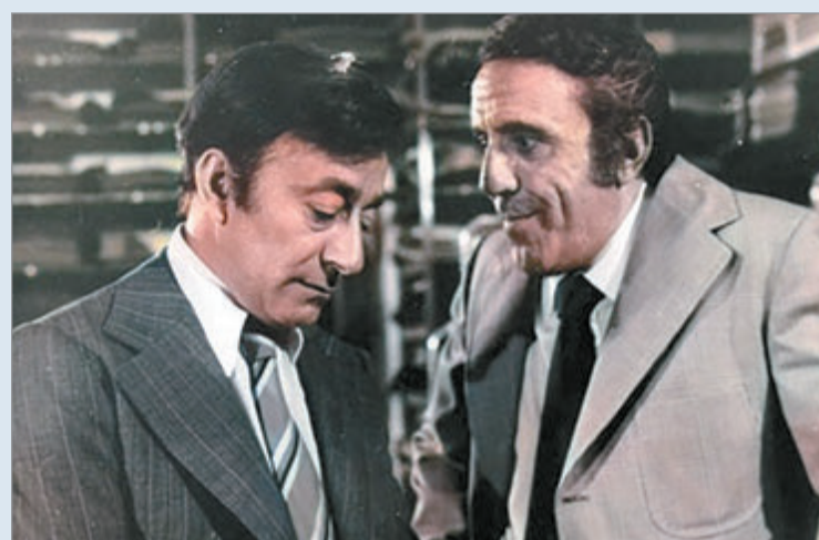
Fue un actor de larga trayectoria en cine, teatro, televisión y radio

Con el paso de los años, su figura comenzó a ganar espacio en el cine nacional. Participó en numerosas producciones que lo convirtieron en un rostro familiar para el público argentino. Sin embargo, fue la llegada de la televisión la que terminó de consolidar su popularidad. Desde la década de 1960 integró el elenco de incontables ciclos, telenovelas y programas uni-