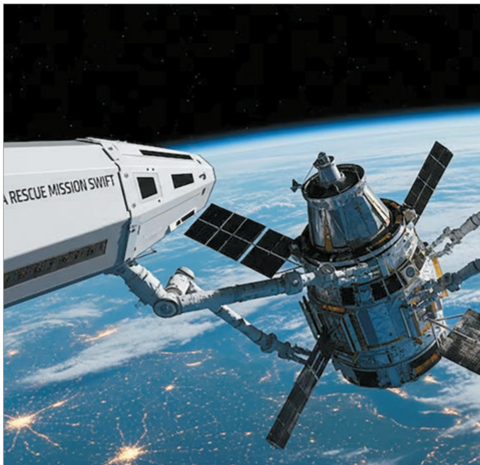
Swift fue diseñado para detectar estallidos de rayos gamma

La nave LINK, construida por Katalyst Space, se acoplará al telescopio espacial Swift para prolongar su vida útil en órbita y evitar su desintegración atmosférica. El lanzamiento está previsto para el 30 de junio