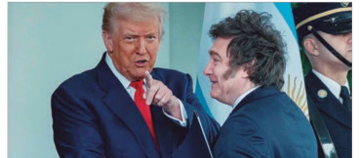
Nuevo apoyo de Milei a Trump

Respecto a la posibilidad de su reelección, Milei deslizó: "O termino en el 2027 o si los argentinos quieren, en el 2031, pero después del 2031 acá a mí no me ven más".