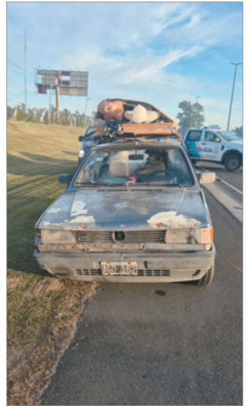
Uno de los coches involucrados