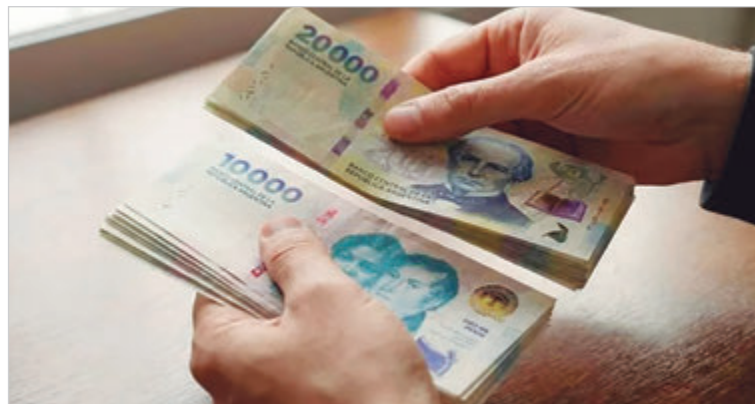
Los bancos redujeron el universo de personas confiables

“De cada 100 personas que fueron a pedir un crédito en los últimos 24