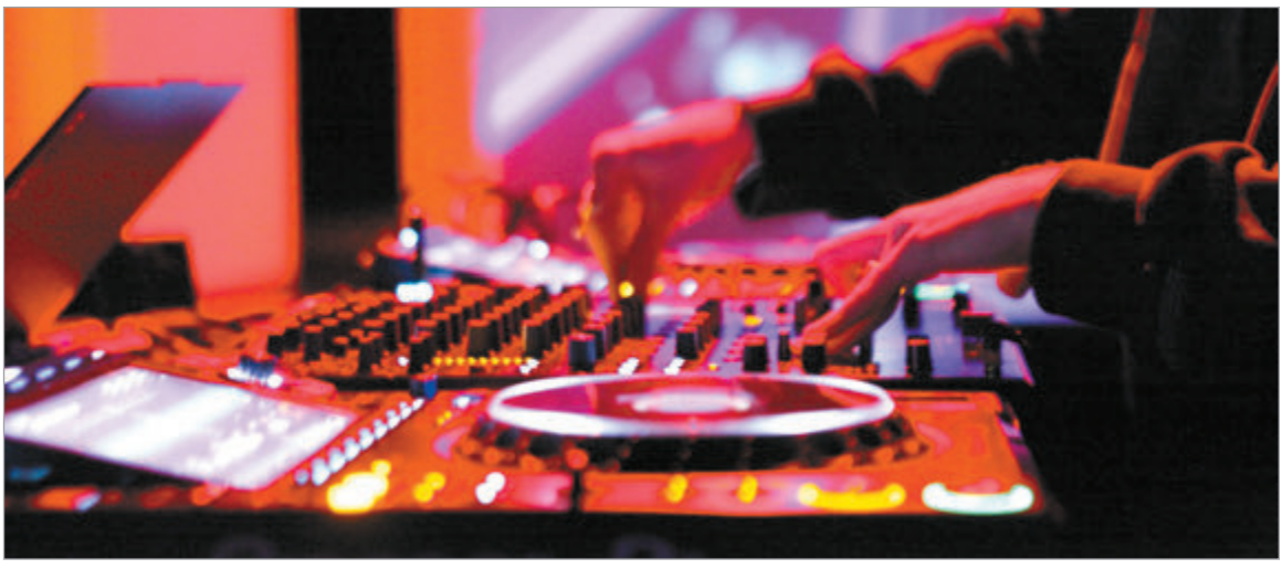
El Pasaje Dardo Rocha recibirá una nueva edición de Antidomingo con música en vivo

Las familias podrán disfrutar espectáculos en vivo, cine, ferias, talleres y exposiciones. La agenda incluye actividades con opciones gratuitas y accesibles durante toda la jornada