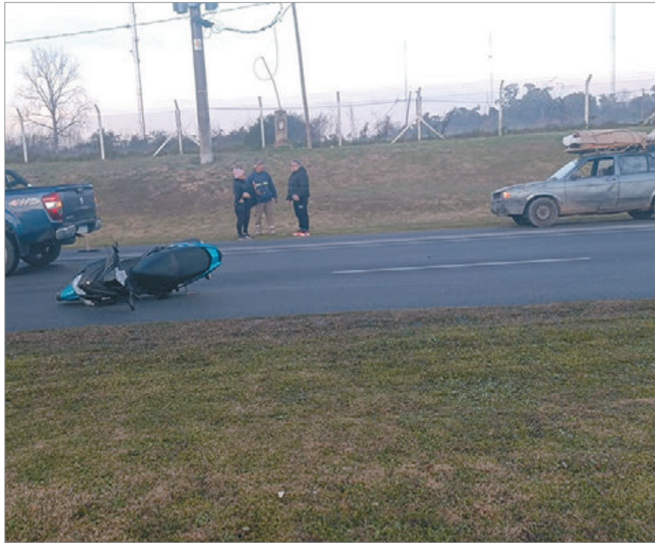
La trágica escena

Minutos después arribó una ambulancia del SAME, ya que las partes pidieron ayuda al 911, pero los profesionales de la salud no pudieron hacer más que constatar el deceso del damnificado. Ahora, resta que las autoridades puedan determinar de manera fehaciente cómo se dio la mecánica del hecho.