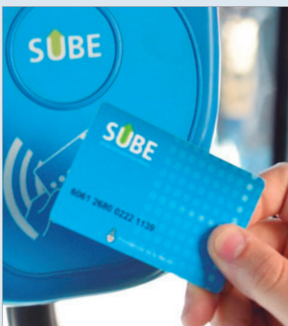
El desplome supera el 15 por ciento y los usuarios migran a promociones bancarias y pagos QR