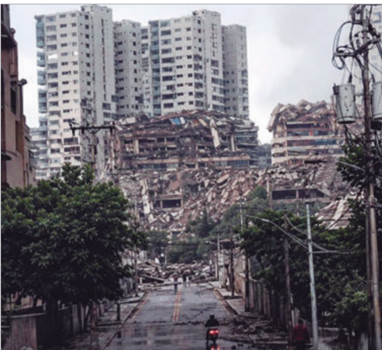
Una nueva réplica volvió a generar alarma este sábado

El balance del desastre continúa creciendo mientras equipos nacionales e internacionales trabajan en las zonas más afectadas. Miles de familias esperan asistencia tras los sismos de magnitud 7,2 y 7,5 registrados el miércoles