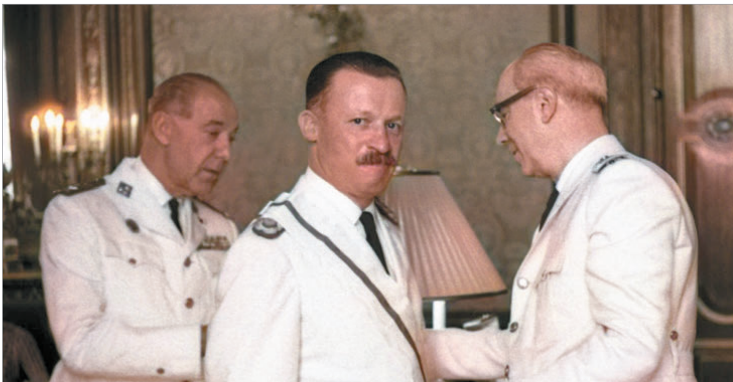
Juan Carlos Onganía murió casi olvidado en junio de 1995