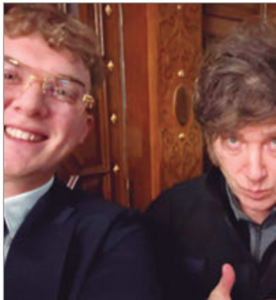
El principal apunto