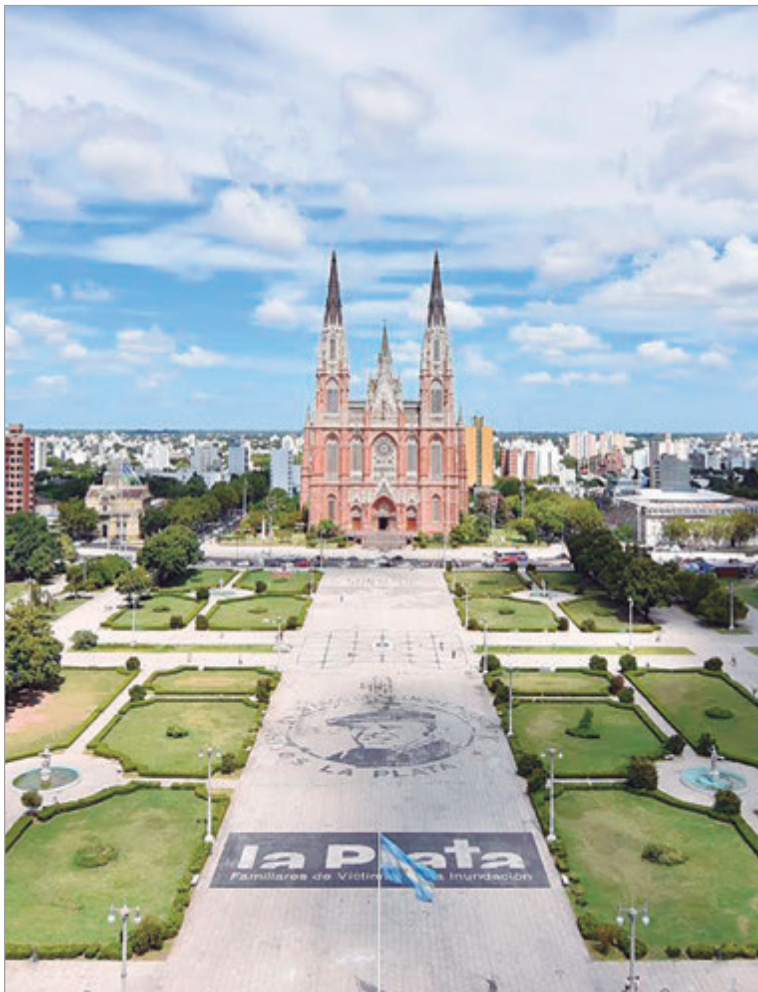
Alak quiere eliminar el estacionamiento de Plaza Moreno

“Vamos a mejorar la Plaza Moreno, no a hacerla nueva. Vamos a sacar el estacionamiento que está frente al Palacio, es una anomalía