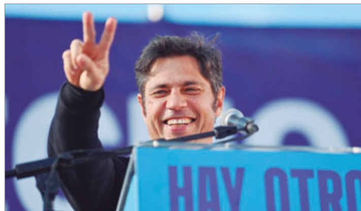
Kicillof apuntala su candidatura para 2027