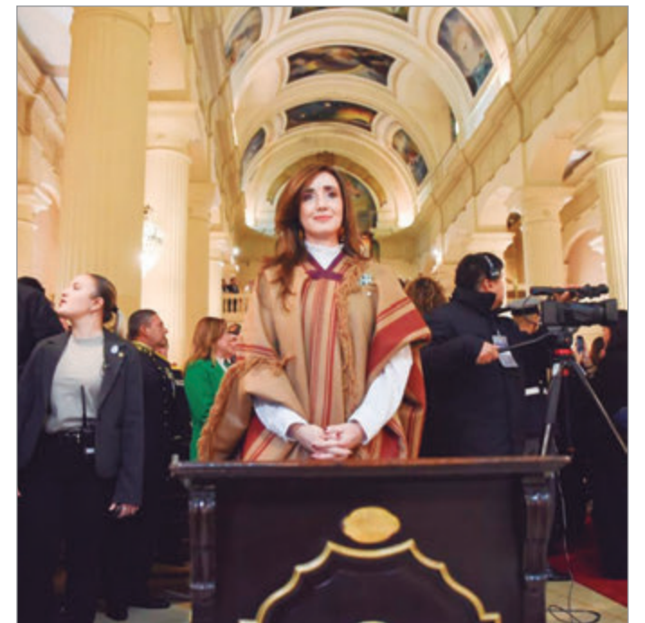
La vicepresidenta respaldó el discurso crítico de la Iglesia y reclamó atender a los sectores más vulnerables

El gesto de Villarruel, en una fecha patria y desde el interior del país, refuerza la idea de un progresivo alejamiento de Milei. Mientras el Presidente buscó mostrarse en otro escenario, la titular del Senado eligió respaldar un discurso que cuestiona directamente el rumbo oficial y se posiciona como voz propia dentro del Gobierno.