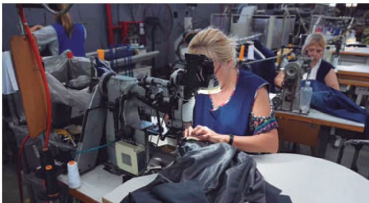
La actividad continúa en mínimos históricos

El freno de la actividad también se refleja en la utilización de la capacidad instalada. Entre enero y abril, las plantas textiles trabajaron en promedio al 36,6% de su potencial, lo que implica que casi dos tercios del equipamiento