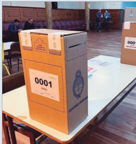
La Libertad Avanza busca debatir en septiembre pero no logra reunir los votos necesarios

El Gobierno quiere avanzar en septiembre con el debate de la reforma electoral en el Senado, aunque reconoce que no cuenta con los votos suficientes para eliminar las PASO ni para establecer un sistema de colectoras. La presidenta del bloque, Patricia Bullrich, admitió que el proyecto está frenado desde abril y que no hay respaldo de la UCR ni del PRO, espacios que suman apoyos clave para alcanzar las mayorías especiales que requiere la iniciativa.