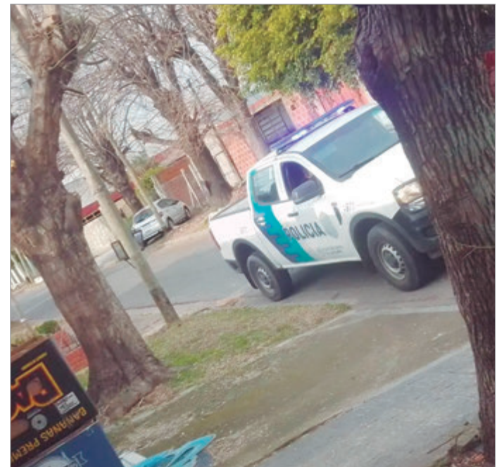
Efectivos en la escena

Mientras avanza la investigación, el denunciante permanece bajo custodia policial. Además, efectivos realizan vigilancia preventiva tanto en su domicilio como durante sus desplazamientos, a la espera de que la Justicia determine las responsabilidades en el caso.