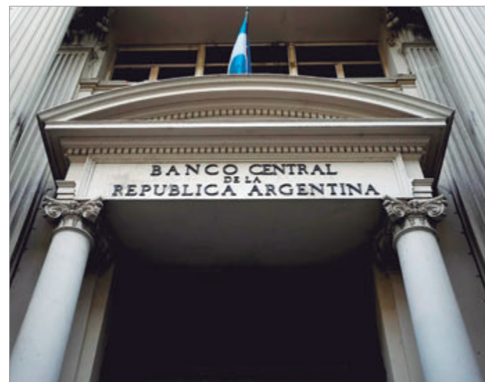
El Central liberó más de 800 millones y afronta vencimientos por 4.300 millones

En paralelo, el Central renovó la totalidad de los REPOs con entidades extranjeras hasta 2028 por un total de 6.000 millones. Con esa herramienta busca asegurarse liquidez para afrontar las elecciones de 2027 y cumplir con las obligaciones financieras del próximo año. El retroceso de las reservas expone la tensión entre la necesidad de mostrar fortaleza cambiaria y la obligación de atender vencimientos que siguen condicionando la política económica.