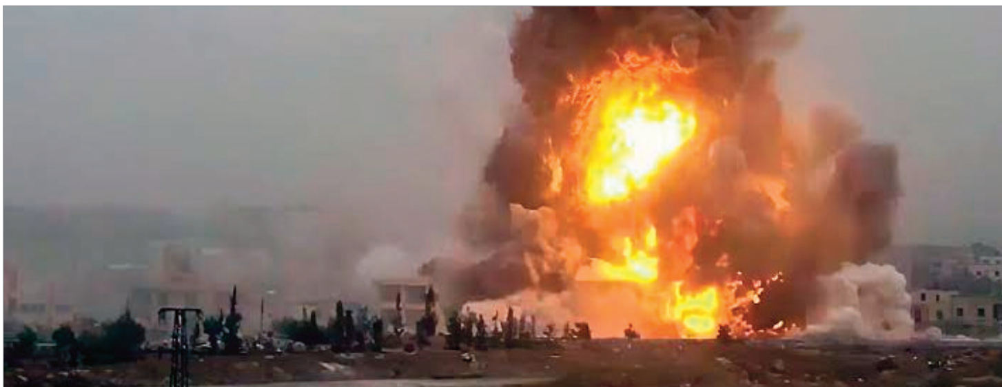
Fuertes explosiones sacudieron distintos puntos de Irán este jueves

La Guardia Revolucionaria reafirmó que el estrecho de Ormuz debe permanecer bajo control iraní y cuestionó la presencia militar estadounidense en la región, mientras continúan los ataques cruzados que elevan la tensión en Medio Oriente