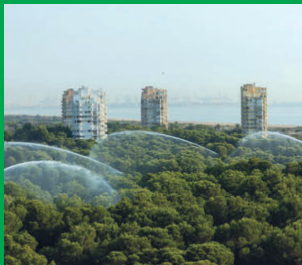
Se despliega un cañón de agua contra incendios en el parque natural de la Albufera en medio de una alerta por calor extremo, en Valencia, España