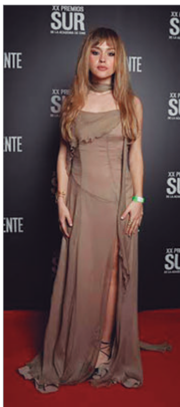
En la red carpet de los Premios Sur

—Se lo acabo de decir a un colega, que si quiere que su hijo se porte bien lo tiene que traer, porque los niños se portan bien mirando el espectáculo. A mí me sorprende mucho. Sí sé que hay un tema con los celulares, con filmar, y que el otro día ha ido una señora con una tablet directamente. Pero bueno, son los tiempos que corren y es difícil culpar a la gente también. Es como un entramado muy difícil de salir, ¿viste?.