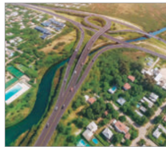
La obra de conexión con la Autopista La Plata-Buenos Aires avanza en la región

Vale resaltar que la obra contempla la ejecución de 2,1 kilómetros de nuevo trazado con doble sentido de circulación, la construcción de pasos sobre las vías del Ferrocarril Roca y los arroyos Martín y Carnaval, además de un terraplén que permitirá optimizar el acceso y la integración de la infraestructura vial.