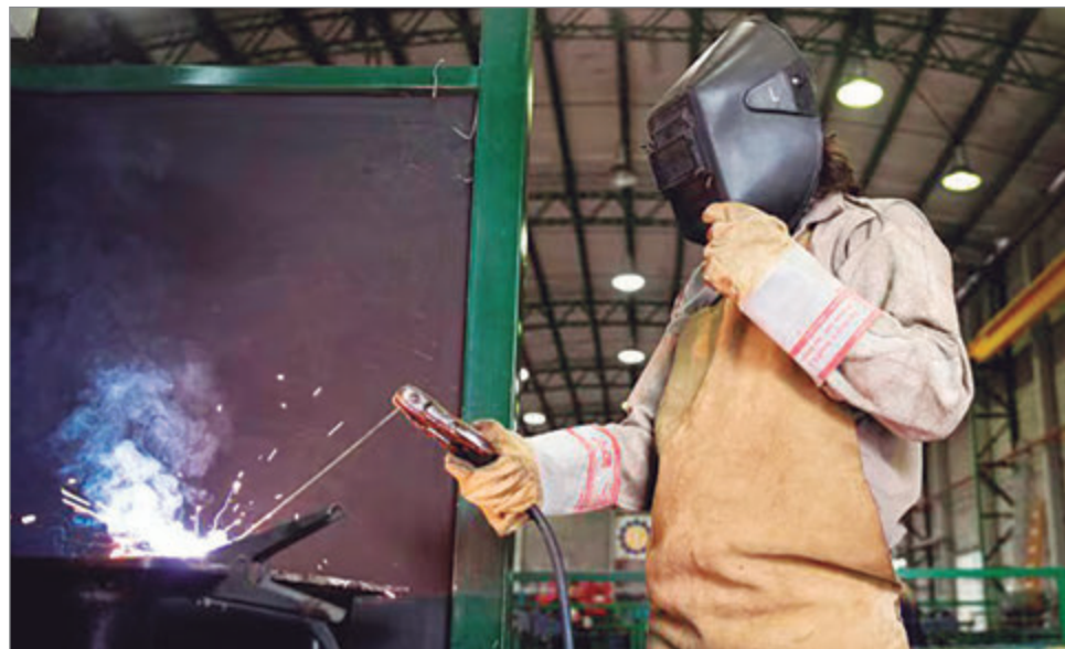
No se revertirá la informalidad al corto plazo según la UCA

pasó a las actividades primarias (39,6%), las finanzas (35,1%) y la minería y explotación de canteras (24,6%), sectores con un efecto mucho más limitado sobre la creación de empleo directo.