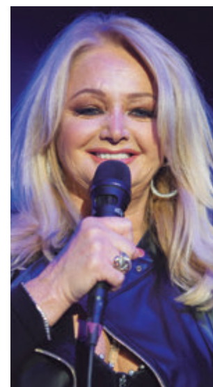
Seguía presentándose en vivo

—Y me encanta hacer drama, me encanta. Pero por eso como vengo a hacer esto, para mí me gustaría hacer algo gracioso.