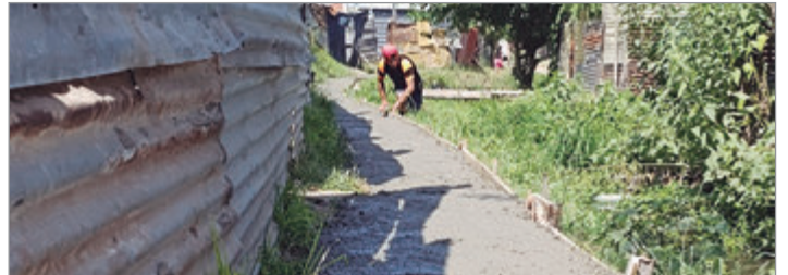
El proyecto se desarrolló en el sudoeste de la ciudad con participación de vecinos

La propuesta consistió en la construcción de veredas utilizando Hormigón Reforzado con Macrofibras Sintéticas, una tecnología que reemplaza las tradicionales mallas de acero por fibras plásticas. Este sistema reduce costos, requiere menos espesor de hormigón, permite construir más metros con el mismo material y ofrece mayor resistencia a la corrosión, lo que facilitó su aplicación en obras de pequeña escala.