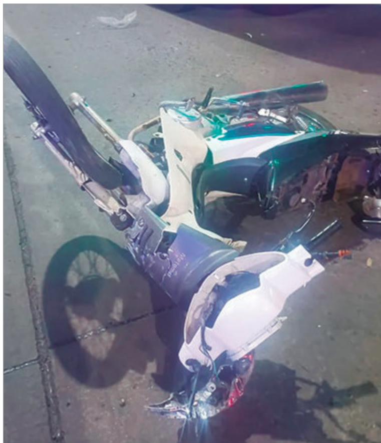
El rodado de la víctima

Las primeras actuaciones indican que la mujer llevaba colocado el casco al momento del impacto y que, a simple vista, no presentaba lesiones externas visibles. Las circunstancias en las que ocurrió el choque