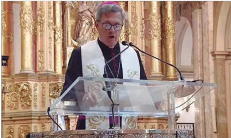
El presidente Milei y su gabinete escucharon la homilía en la Catedral

García Cuerva insistió en que el país necesita acuerdos básicos sustentados en valores comunes. Señaló que las heridas sociales reclaman diálogo, justicia y honestidad,