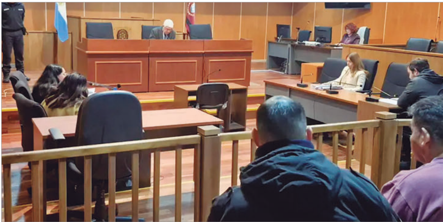
Se condenó al acusado a 15 años

En la lectura de alegatos, la funcionaria judicial remarcó que el adulto aprovechaba las ocasiones en las que la madre se iba de la vivienda a trabajar, al tiempo que le suministraba bebidas a la menor con tal de que se duerma y cometer los abusos.