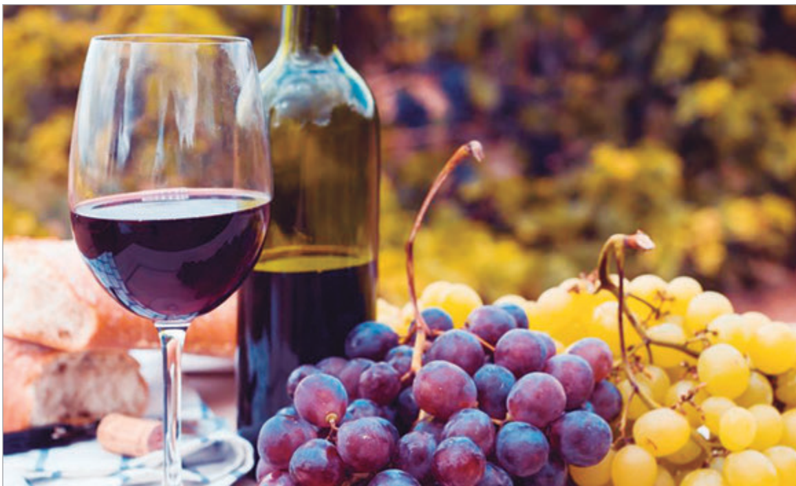
Se desarrollarán diferentes actividades como el concurso de Vinos Caseros

Se desarrollará en el Gimnasio Municipal de Berisso y será el punto de encuentro para disfrutar de una gran variedad de propuestas para toda la familia. El rol de la UNLP en el tradicional festejo