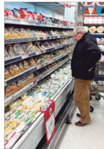
Las ventas acumulan un año de caída

“Lo que muestran las estadísticas no es casual, sino una decisión deliberada de política económica. Este modelo necesita de un consumo deprimido, aunque eso signifique dejar afuera a la mayoría de la población”, concluyó López.