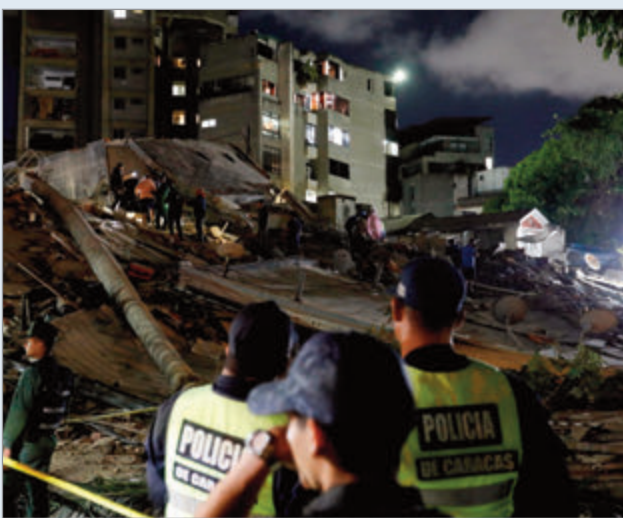
La cifra de víctimas fatales volvió a incrementarse

El balance oficial por los devastadores terremotos que sacudieron el norte de Venezuela el pasado 24 de junio volvió a agravarse. En las últimas horas, el presidente de la Asamblea Nacional, Jorge Rodríguez, informó que la cifra de fallecidos ascendió a 3.811, mientras que el número de heridos se mantiene en 16.740.