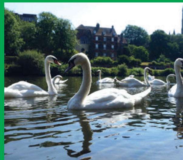
Cisnes en el río Severn. Se prevé que las temperaturas sigan subiendo en todo el Reino Unido durante la semana