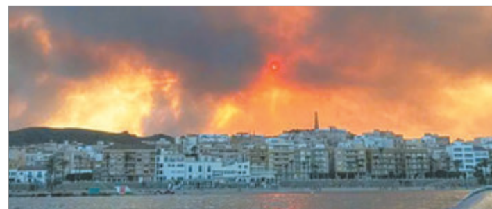
El fuego arrasó más de 3.200 hectáreas en la provincia de Almería

Mientras prosiguen las tareas de búsqueda, las autoridades españolas no descartan que el número de víctimas continúe aumentando en las próximas horas, en uno de los incendios forestales más graves registrados este verano en el sur de Europa.