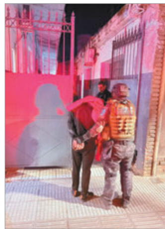
El procedimiento de la fuerza

Además, alquilaba una habitación al frente del inmueble para ejercer el delito, al tiempo que los uniformados incautaron envoltorios de cocaína, dinero y otros elementos de relevancia para la investigación, tras el hallazgo por parte de los perros detectores de narcóticos.