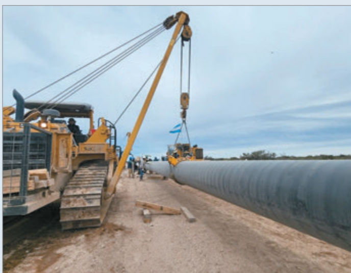
Vaca Muerta se desarrolla con capitales extranjeros

El grupo Techint recibió un nuevo golpe: quedó afuera de una de las principales licitaciones asociadas al desarrollo de Vaca Muerta. De esta manera, se repitió el escenario de enero pasado tras los ataques verbales de Javier Milei al CEO de la empresa, Paolo Rocca.