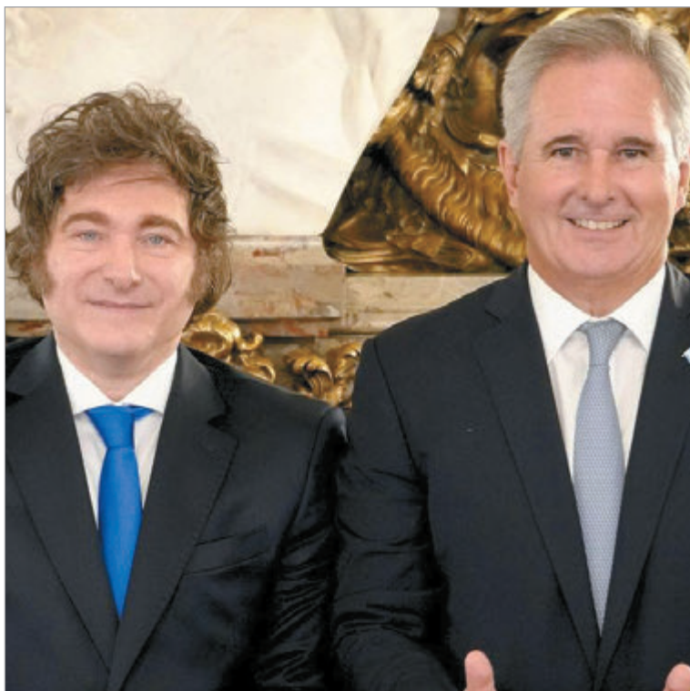
Un buque británico no informó su cruce por aguas argentinas

Un buque de guerra británico cruzó aguas argentinas. El gobierno de Tierra del Fuego denunció una “provocación inadmisible”, pero Cancillería evitó pronunciarse