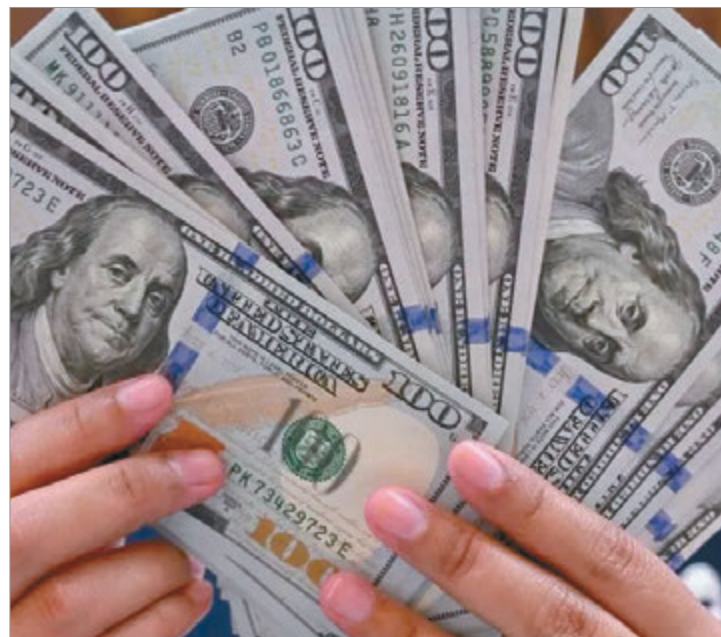
El transporte fue lo que más se encareció

Según Fundar, en términos generales los precios en Argentina se ubican en torno al promedio latinoamericano. “El costo de vida es más bajo que el de Uruguay, México y Chile y más alto que el de Brasil, Colombia, Honduras y Paraguay”, concluyó.