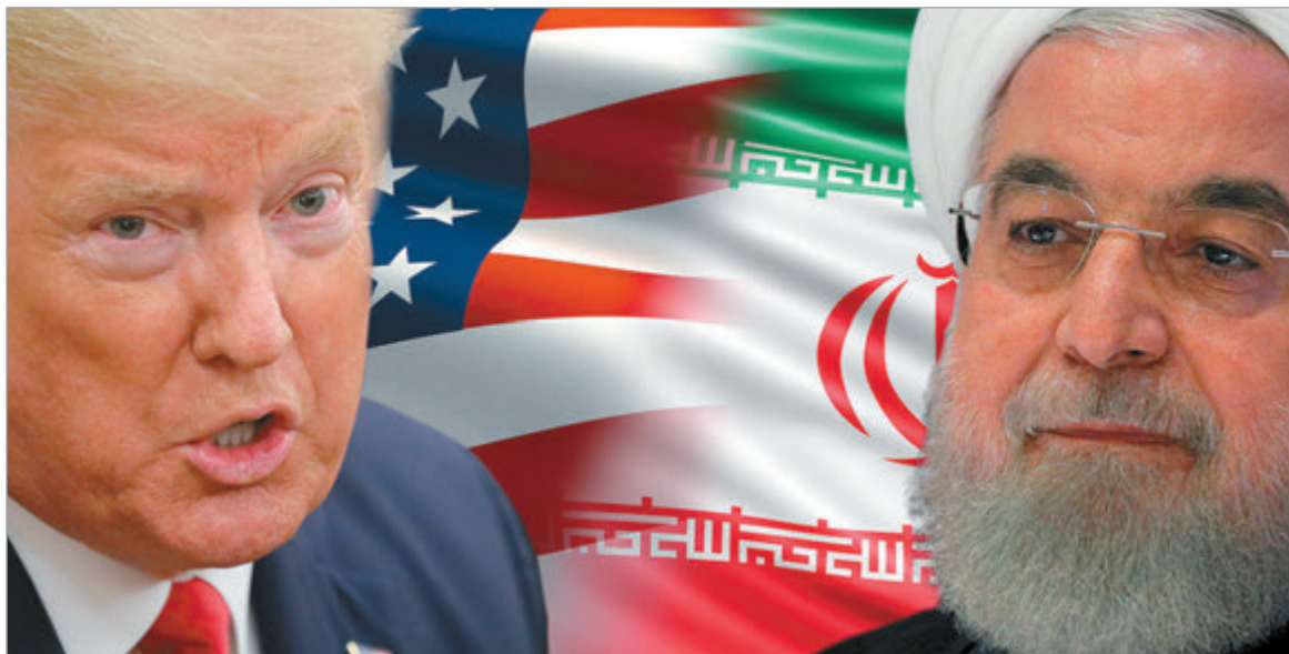
El conflicto entre EE. UU. e Irán volvió a reactivarse

Washington aceptó retomar el diálogo con Teherán, aunque Donald Trump dio por finalizado el alto el fuego. Mientras continúan los ataques, la disputa por el estrecho de Ormuz vuelve a ocupar un lugar central en la crisis regional