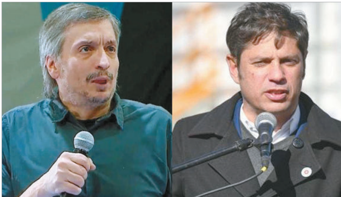
La pulseada por el liderazgo entre el gobernador y la agrupación divide las opiniones

La tensión entre Kicillof y La Cámpora aumenta y obliga a reordenar las estrategias para la construcción electoral del principal bastión peronista