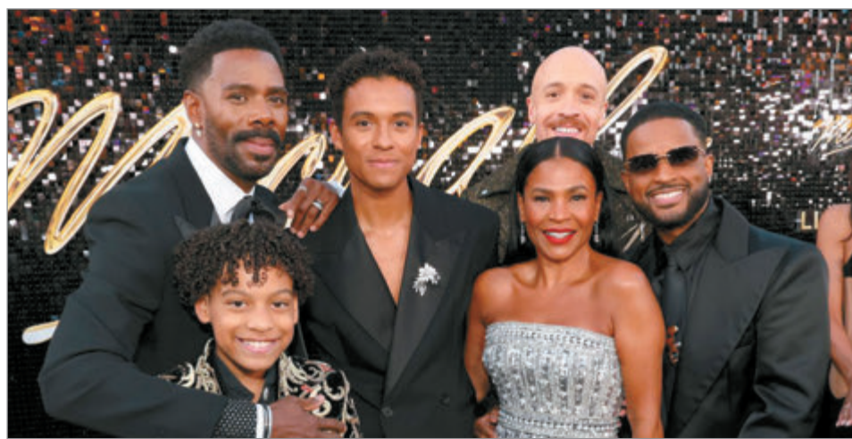
En la premiere

—Colman Domingo: Creo que mi forma de acercarme a Joseph Jackson fue examinar realmente a un hombre de esa época. Siento que para contextualizarlo y entender de dónde vienen sus raíces, de Arkansas, como trabajador de clase obrera en una acería, un hombre de la época de Vietnam, observar su forma de ser y cómo ama a su familia es diferente a lo que se ve en un contexto muy moderno. Lo analizo desde una perspectiva similar a la que uso para ver a mi padrastro, quien formaba parte de una generación de hombres que creían que su trabajo era ser el sustento y el encargado de imponer disciplina, y brindar estructura a la familia, mientras que la madre aportaba la ternura y el cuidado. Y al observar eso, me di cuenta de que, para Joseph, la forma de amar era a través del rigor, la estructura y la disciplina. Eso es amar desde su perspectiva. Así que, para mí, una vez que me metí en su piel y miré a través de los ojos de José, tuve que verlo primero como un padre. Y alguien que tenía nueve hijos y que iba a ser el sustento de la familia. Y que además sabía que sus hijos tenían talento. Y quería darles, ¿cómo decirlo?, lo mejor que él tenía. ¿Entiendes lo que quiero decir? Es decir, tal vez no tuviera