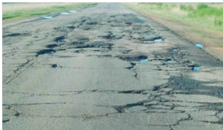
Fepevina denunció desinversión y falta de insumos

Asimismo, la federación cuestionó el proceso de privatización que impulsa el Gobierno nacional para concesionar 20.000 kilómetros de rutas, señalando que la prometida inversión privada