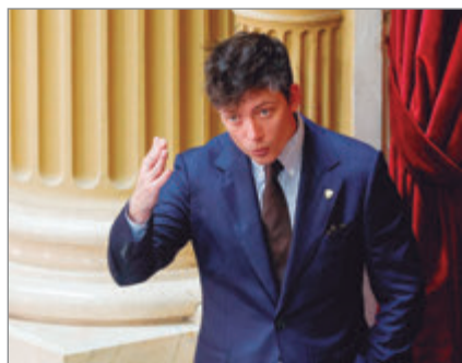
El asesor presidencial ratificó su lealtad en redes sociales

Considerado por el propio mandatario como “el verdadero arquitecto” de la victoria libertaria, Caputo refuerza su papel de estratega y custodio político en un Gobierno que enfrenta críticas por su concentración de poder.