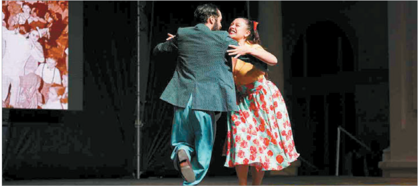
La programación incluye recorridos guiados y muestras artísticas

Asimismo, a las 16:30 el Cine Select proyectará Wall-E en una función distendida destinada a personas con TEA con iluminación tenue, volumen moderado, libertad de movimiento, ambiente comprensivo, comunicación clara,