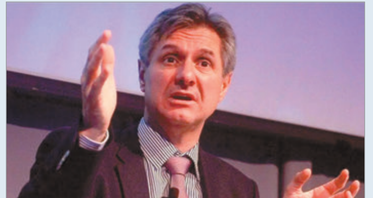
Daza reconoció que la población aún no percibe la mejora económica y prometió más crédito privado

Según Daza, la meta de la gestión es evitar el endeudamiento a tasas elevadas, consolidar el superávit y robustecer las reservas, con la expectativa de llegar a los comicios con un riesgo país en descenso sostenido y un escenario de mayor previsibilidad para los mercados.