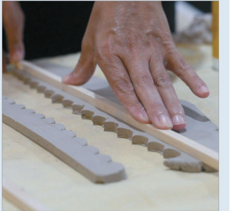
Podrá visitarse todo el mes en el Centro Cultural y de la Memoria Islas Malvinas

Con 30 años de trayectoria en la ciudad, el Taller de Arte Lo de Lola Mora (49 entre 16 y 17), dirigido por