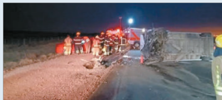
El lugar del siniestro

En el minibús viajaban menores, de entre 9 y 12 años, quienes regresaban de disputar un partido en Río Cuarto. Se informó que 16 niñas debieron ser atendidas por golpes o traumatismos, pero ninguna se encuentra en grave estado. Si fallecieron un hombre y una mujer, ambos mayores de edad, quienes viajaban en el coche.