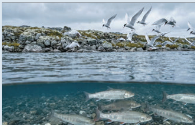
Las aves migratorias transportan menos parásitos entre islas del Atlántico Norte

Las aves migratorias recorren miles de kilómetros cada año entre el Ártico y las zonas cálidas del planeta. Investigadores científicos de Estonia, Suecia, Groenlandia y las Islas Feroe descubrieron que, pese a esos viajes, transportan muchos menos parásitos entre islas de lo que los científicos esperaban. El hallazgo contradice una idea extendida en la biología: que esas aves actúan como grandes “transportistas” de parásitos entre regiones distantes del Atlántico Norte. Las implicancias alcanzan a la forma en que se entiende la distribución de la vida en ecosistemas árticos.