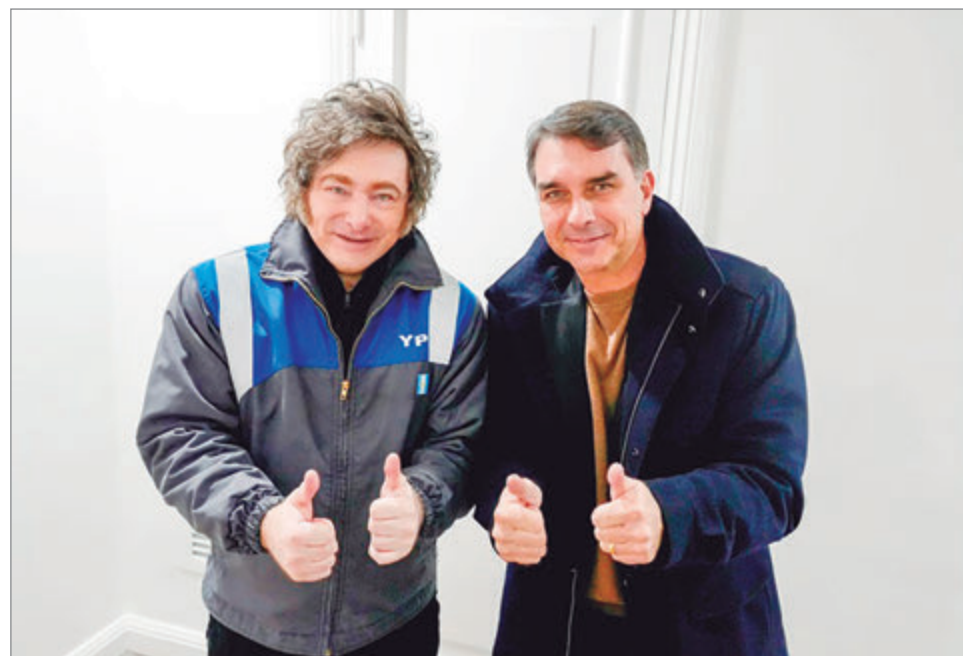
La visita reaviva el choque con Lula y suma presión en el Mercosur

Cabe mencionar que el viaje a San Pablo y Brasilia se suma a una serie de compromisos que incluyen las asunciones de Keiko Fujimori en Perú y Abelardo de la Espriella en Colombia, ambos triunfos cuestionados por organismos internacionales por sus antecedentes judiciales. También está prevista una visita a Daniel Noboa en Ecuador, donde Milei buscará firmar acuerdos pendientes en materia de seguridad, comer-