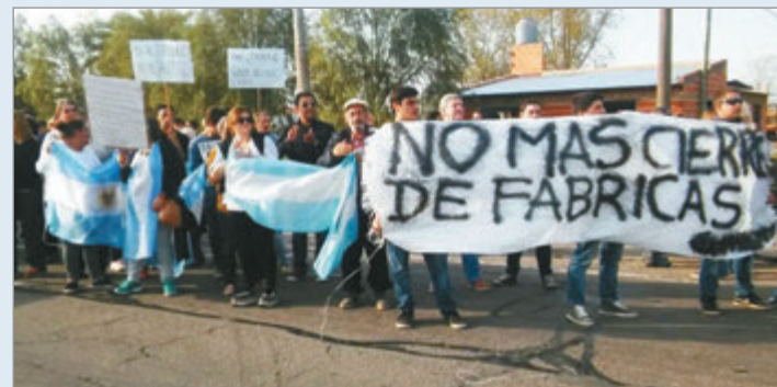
Presentan un proyecto en la Legislatura bonaerense para frenar el cierre de empresas por dos años

La actividad fabril muestra números en rojo con caídas severas en los rubros automotriz, metalúrgico, textil y de la construcción. Las pequeñas y medianas empresas enfrentan caídas sostenidas en sus ventas, lo que multiplica los conflictos por atrasos salariales o cesantías. Desde el bloque del FIT-U advirtieron además que la reciente reforma laboral facilitará los despidos al permitir indemnizaciones en cuotas, un factor que aceleraría la precarización si la Legislatura no interviene de forma urgente para proteger la estabilidad de los trabajadores.